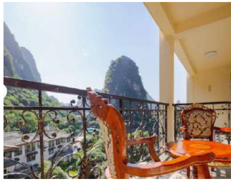
Guilin : Park Hotel