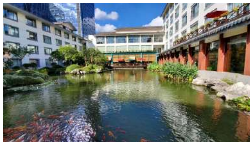
Shanghai : SSAW Shanghai Bund Hotel