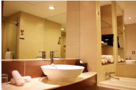
Yangshuo : New West Street Hotel