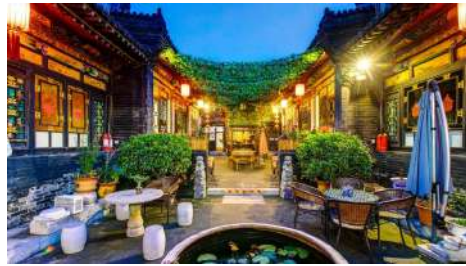
Xi'an : Grand Noble Hotel