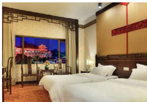
Suzhou : Suyuan Hotel