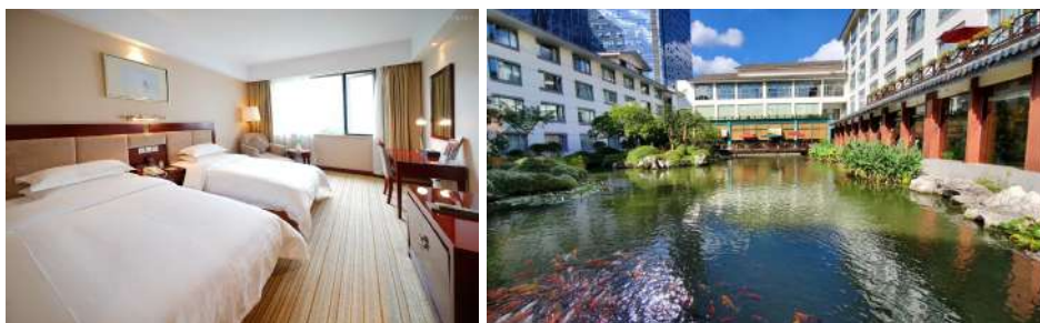
Shanghai : SSAY Hotel Boyang